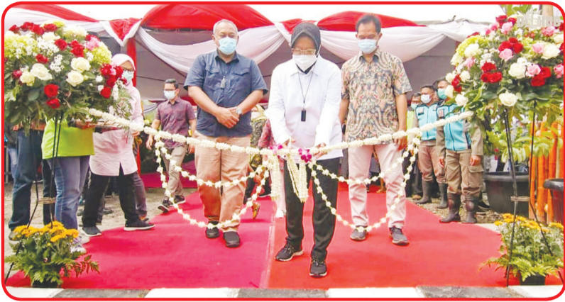
Walikota Surabaya Tri Rismaharini secara simbolis memotong pita sebagai tanda diresmikannya Komplek SIR.