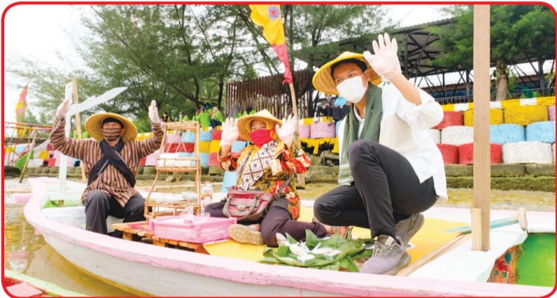
Pasar Apung Surabaya di Komplek SIR sebagai daya tarik wisata pantai.