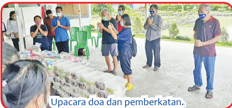
Upacara doa dan pemberkatan.