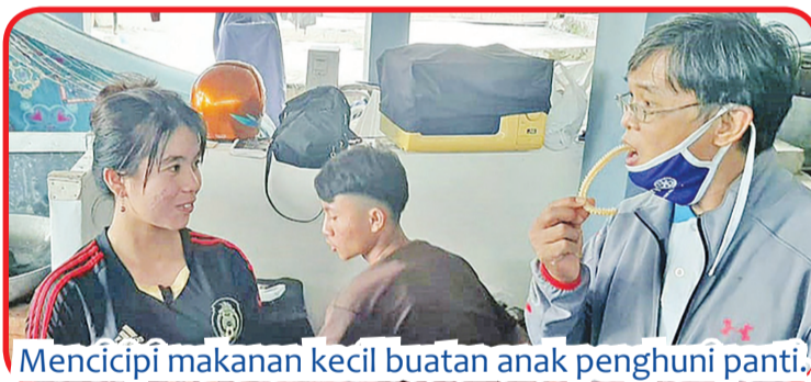
Mencicipi makanan kecil buatan anak penghuni pantti.