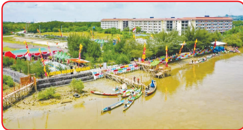
Komplek SIR dibangun satu kawasan dengan Rusun Romokalisari untuk meningkatkan perekonomian warga nelayan.

SURABAYA (IM) - Bertambah lagi sebuah tempat wisata kuliner yang edukatif di kota Pahlawan Surabaya. Ini setelah diresmikannya Komplek Sentra Ikan Romokalisari (SIR) oleh Walikota Surabaya, Tri Rismaharini, Kamis (10/12) lalu.