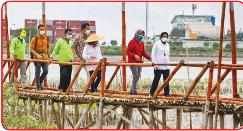
Walikota Surabaya Tri Rismaharini menjau lokasi.