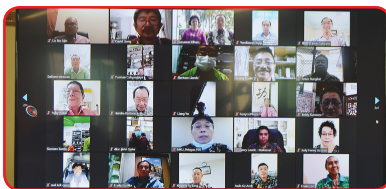
Para tokoh dan pengurus Perwaguzsi dari berbagai provinsi yang mengikuti pelantikan secara online.